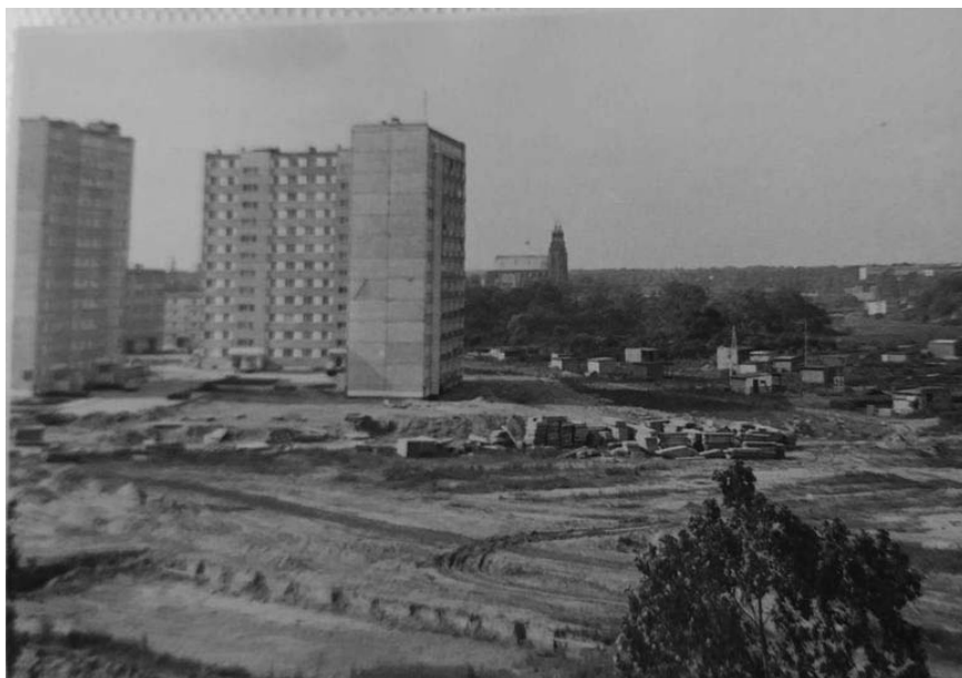
Fot. 19. Plac przygotowany pod budowę Szkoły Podstawowej nr 12 na Osiedlu Kazimierza Wielkiego. Po lewej stronie widoczne bloki Osiedla Władysława Łokietka. Zdjęcie wykonane w 1984 r.; https://www.facebook.com/groups/2483898861882179 ; dostęp w dniu 16.11.2021 r.