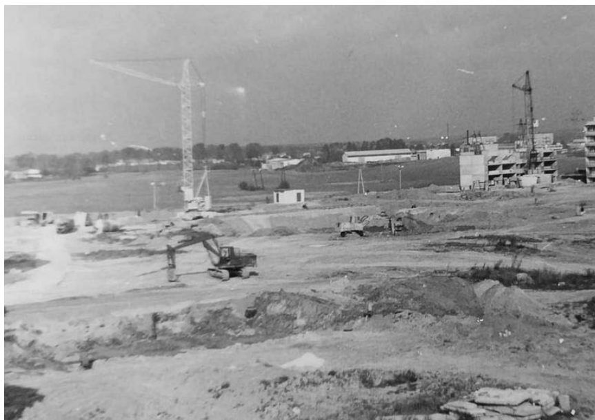
Fot. 17. Teren przyszłego Osiedla Kazimierza Wielkiego. Zdjęcie wykonane ok. 1986 r.; https://www.facebook.com/groups/2483898861882179 ; dostęp w dniu 16.11.2021 r.