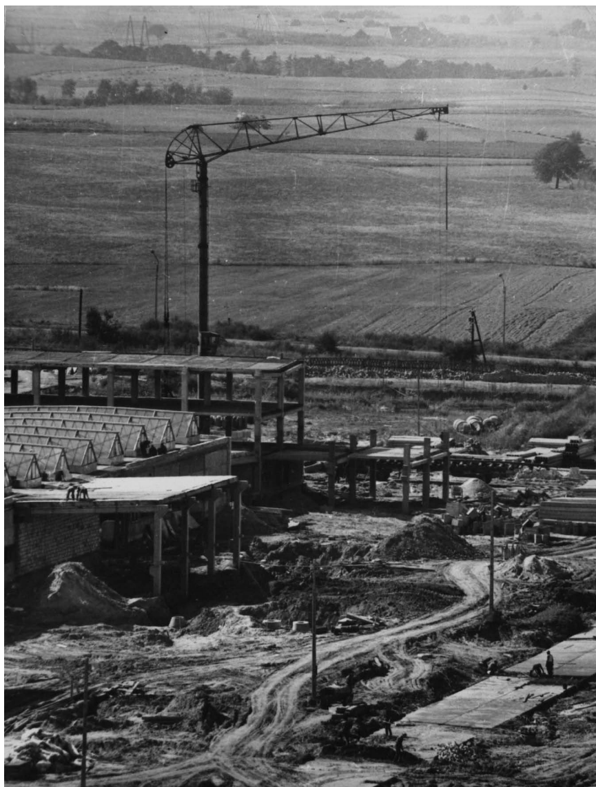
Fot. 2. Budowa WZO Polania. Widoczne fragmenty hali głównej i biurowca oraz pola po zachodniej stronie ul. 22 Lipca. 1971 r. Fot.: Janusz Chlasta. Zdjęcie wykonane w 1971 r.; APP OG, Archiwum fotograficzne redakcji gazety „Głos załogi” (dalej: Fotografie „Głosu załogi”) sygn. 90.