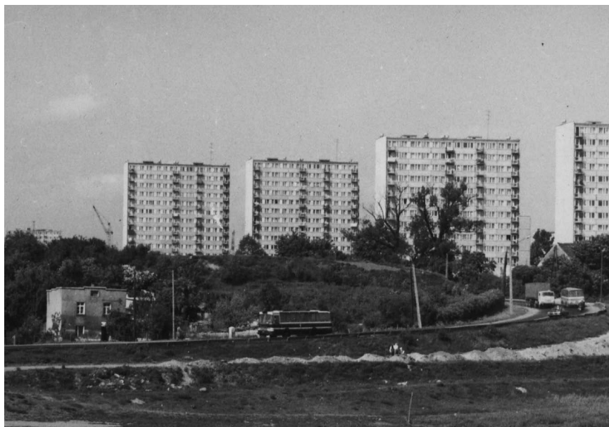
Fot. 9. Ulica 22 Lipca i wieżowce na Osiedlu Orła Białego. Widoczny dom Andrzeja Wójcika a w głębi budowane wieżowce na Osiedlu Jagiellońskim. Fot.: Janusz Chlasta. Zdjęcie wykonane w 1980 r.; APP OG, Fotografie „Głosu załogi”, sygn. 9.