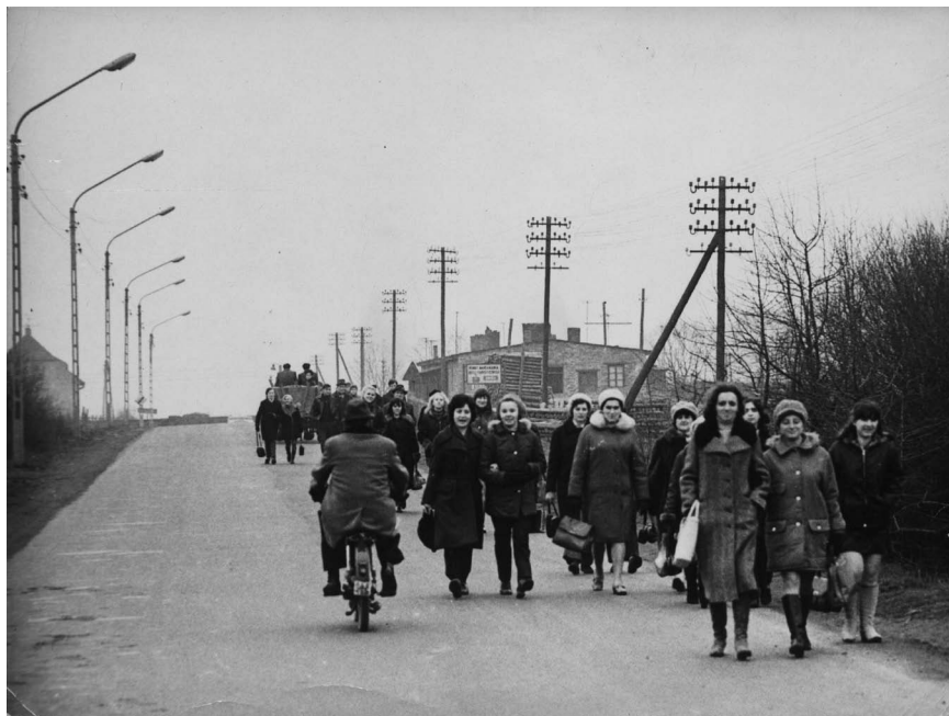
Fot. 6. Część załogi WZO Polania na ul. 22 Lipca w drodze ze stacji Gniezno-Winiary do pracy. W głębi, po lewej widoczny dom mieszkalny pracowników PKP przy torach kolejowych do Nakła. Po prawej budynek już nieistniejący.

Fot.: Janusz Chlasta. Zdjęcie wykonano 25.02.1972 r.; APP OG, Fotografie „Głosu załogi”, sygn. 144.