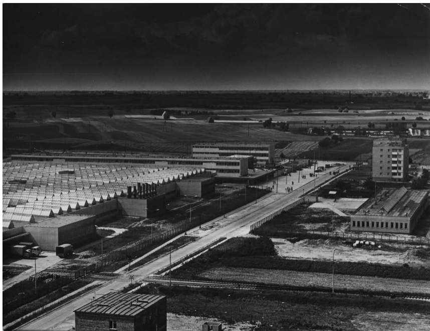
Fot. 3. WZO Polania po zakończeniu budowy. Autor fot. nieznanym. Zdjęcie wykonane w 1972 r.; APP OG, Fotografie „Głosu załogi”, sygn. 99.