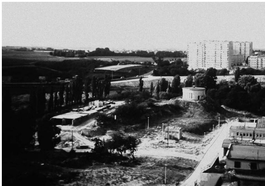
Fot. 12. Widok z wieżowca przy ul. Sobieralskiego w kierunku północnym. Widoczna część zabudowy osiedli Orła Białego i Jagiellońskiego. W miejscu przyszłych osiedli Władysława Łokietka i Kazimierza Wielkiego – pola uprawne. zdjęcie wykonane między r. 1980 a 1983.