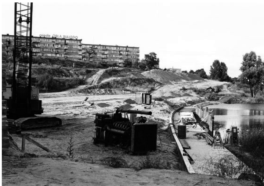
Fot. 21. Budowa fragmentu Trasy 40-lecia PRL między jeziorem Winiary a Osiedlem Orła Białego. Zdjęcie wykonane w 1995 r.