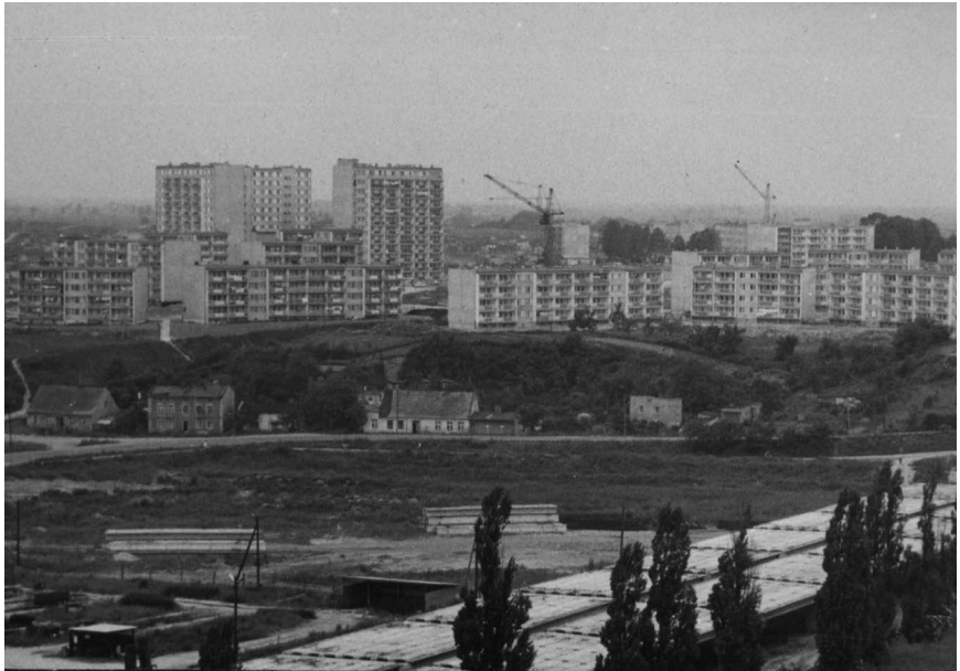
Fot. 18. Osiedle Władysława Łokietka. W głębi powstające Osiedle Kazimierza Wielkiego. Na pierwszym planie rozpoczęta budowa Wiaduktu Solidarności. Autor fot. Zdzisław Stoltman. Zdjęcie wykonane 20 czerwca 1984 r.; APP OG, Fotografie „Głosu załogi”, sygn. 18.