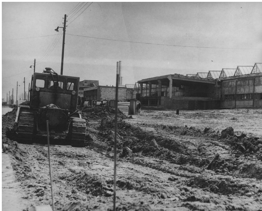
Fot. 1. Budowa Wielkopolskich Zakładów Obuwia (WZO) Polania. Autor nieznanym. Zdjęcie wykonane w 1971 r. Składnica akt Gnieźnieńskiej Spółdzielni Mieszkaniowej.