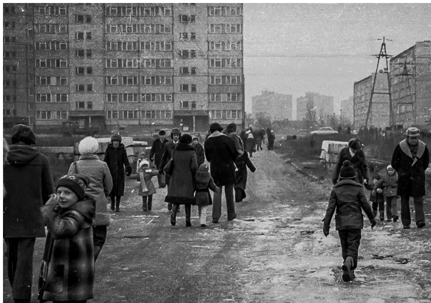
Fot. 14. Osiedle Piastowskie. W głębi widoczne wieżowce przy ul. Sobieralskiego. Zdjęcie wykonane po r. 1986