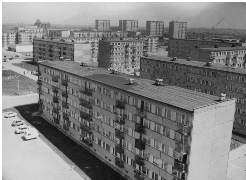
Fot. 13. Fragment Osiedla Orła Białego i Piastowskiego. W głębi widoczny elewator zbożowy i zabudowania WZO Polania. W głębi, po prawej stronie początek budowy południowego skrzydła Szkoły Podstawowej nr 10. Autor fot.: Leszek Domański. Zdjęcie wykonane między 1980 a 1981 r.; APP OG, Fotografie „Głosu załogi”, sygn. 15.