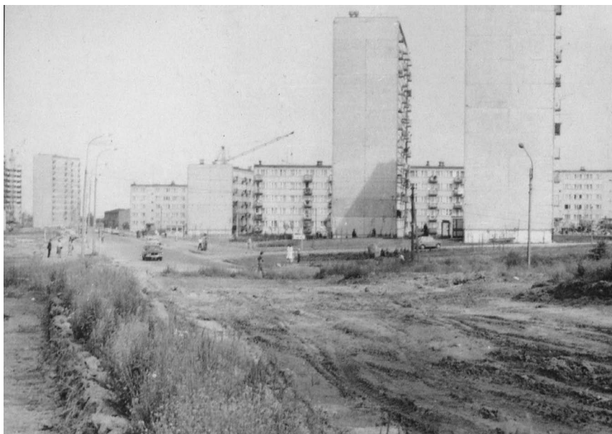
Fot. 10. Przygotowanie terenu pod budowę ul. Biskupińskiej. Po lewej widoczny fragment placu, na którym stanie tymczasowa kaplica parafialna. Autor fot. nieznany. Zdjęcie wykonane prawdopodobnie przed r. 1981. [W:] Parafia Błogosławnego Radzyna Gaudentego w Gnieźnie (1981 – 2006), Gniezno 2006, s. 513.