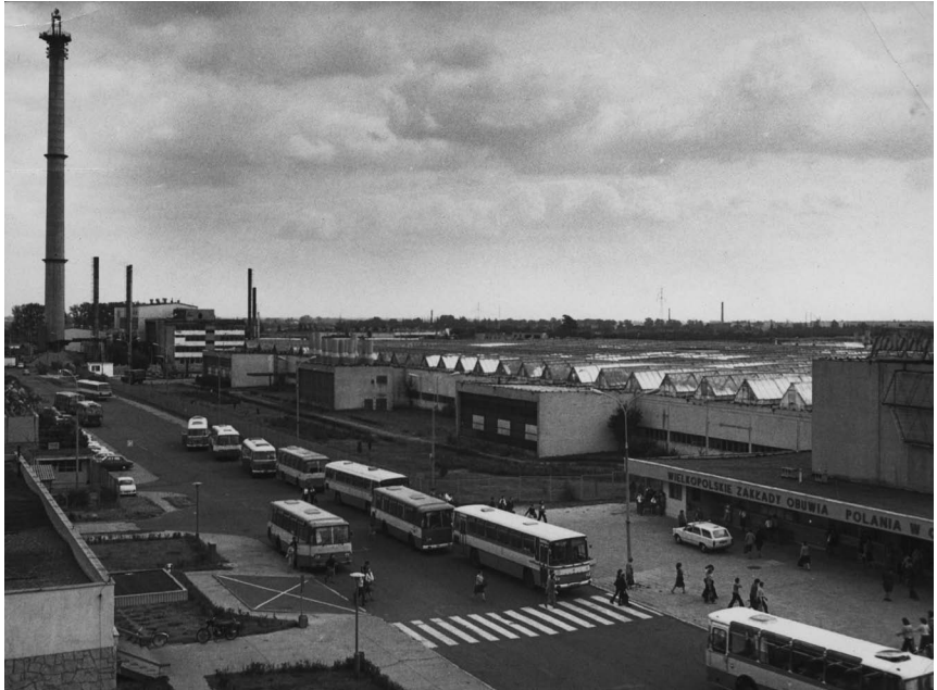
Fot. 4. Autobusy oczekujące na wyjście pierwszej zmiany pracowników WZO Polania z fabryki. W głębi widoczny nieukończony komin PEC. Zdjęcie wykonano 3.09.1972 r.