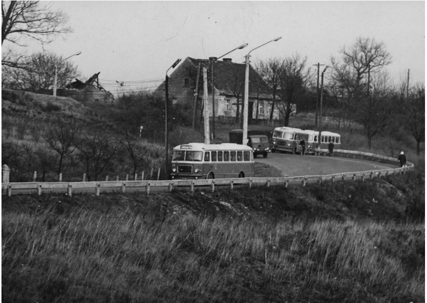
Fot. 8. Zbieg ulic 22 Lipca i Orcholskiej przed przebudową. Widoczny dom mieszkalny Andrzeja Wójcika. Fot.: Janusz Chłasta. Zdjęcie wykonano w grudniu 1972 r.; APP OG, Fotografie „Głosu załogi”, sygn. 10.