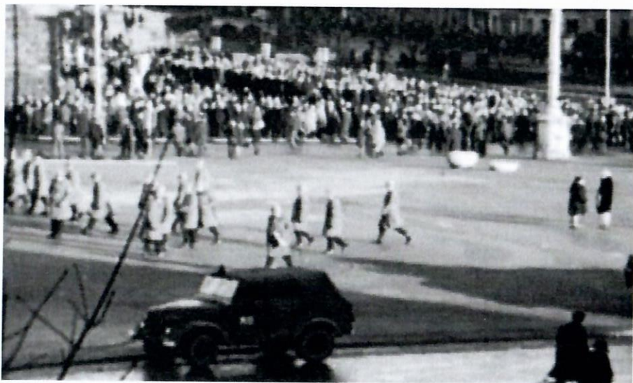
Kadry z filmu Zbysława Kaczmarka "Między Czerwcem a Grudniem był Marzec", TVP Poznań.